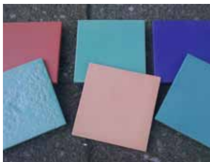
Een kleine greep uit het ruime en kleurrijke assortiment van onze nieuwe tegels.

de tegel, zijn we verzekerd van een goede hechting van deze tegel. Mocht u belangstelling hebben: kom een keer langs in onze kachelwerkplaats en laat u voorlichten door onze medewerkers. U dient er bij deze nieuwe tegels van Suzan Fila wel even rekening mee te houden dat er een levertijd van minimaal enige weken is.