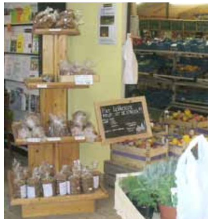
De winkel van Hof van Twello bij Deventer.

Sinds onze studiedag hebben wij meerdere malen, vanuit de boerengemeenschap, de vraag gehoord: wie kan mij helpen om van mijn bedrijf een rendabel stadsgericht kringloopbedrijf te maken? De Twaalf Ambachten heeft hier, als centrum voor ecologische technieken, uiteraard niet alle antwoorden op. Waar wij als kleine stichting wel goed in zijn, zo is gebleken op onze studiedag, is het samenbrengen van mensen met vragen en mensen met antwoorden. Momenteel zijn wij dan ook bezig met een eerste onderzoek naar de mogelijkheden van een zo breed mogelijke adviesgroep voor boeren die graag anders willen, maar niet weten hoe te beginnen. Deze groep moet bestaan uit, in de eerste plaats, praktijkmensen en erva-