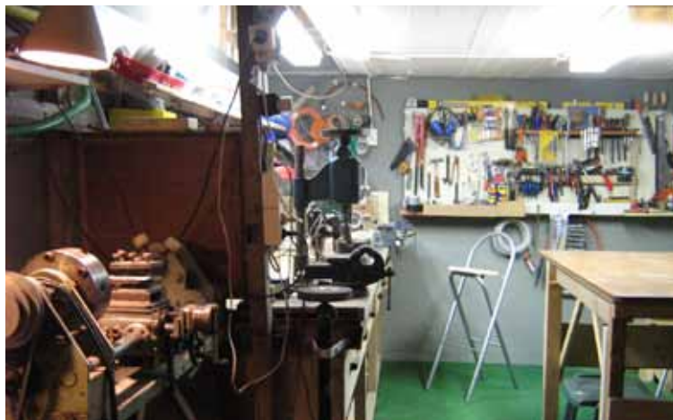
De reparatiekelder in Breskens.