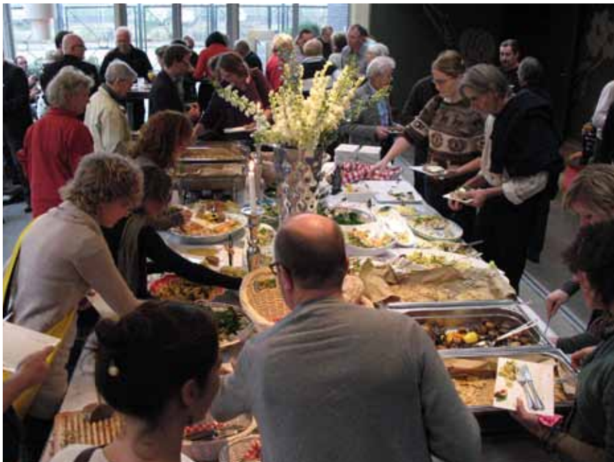
Lunch: keuze uit vele heerlijke streekgerechten.