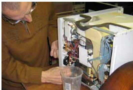
Reparatie van een magnetron in de werkplaats van ons filiaal in Breskens.

Nog een feestelijk bericht: binnenkort verwelkomen we in onze kachelwerkplaats de vijfhonderdste kachelbouwer! Dat is hoe dan ook een feestje waard. Wie de vijfhonderdste wordt weten we nu nog niet. Maar zeker is dat we hem of haar niet zonder leuke verrassing naar huis laten gaan! Mocht u plannen hebben om uw eigen kachel te komen bouwen: de vijfhonderdste bouwer verwachten we in april/mei. Misschien bent u het wel!